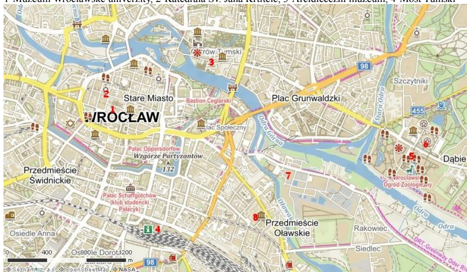
Mapa širšího centra Wrocławu

1-Muzeum Wrocławské univerzity, 2-Katedrála Sv. Jana Křtitele, 3-Arcidiecézní muzeum, 4-Most Tumski