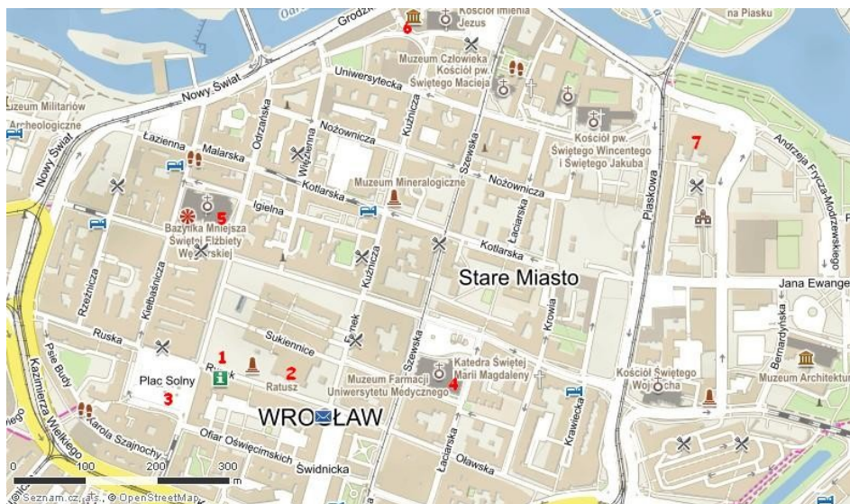
Mapa centra wrocławského Starého města

Wroclaw (česky Vratislav, německy Breslau) je čtvrté největší polské město ležící na řece Odře v jihozápadním Polsku. Wroclaw je historické hlavní město Dolního Slezska i celého Slezska a nynějším správním centrem Dolnoslezského vojvodství.