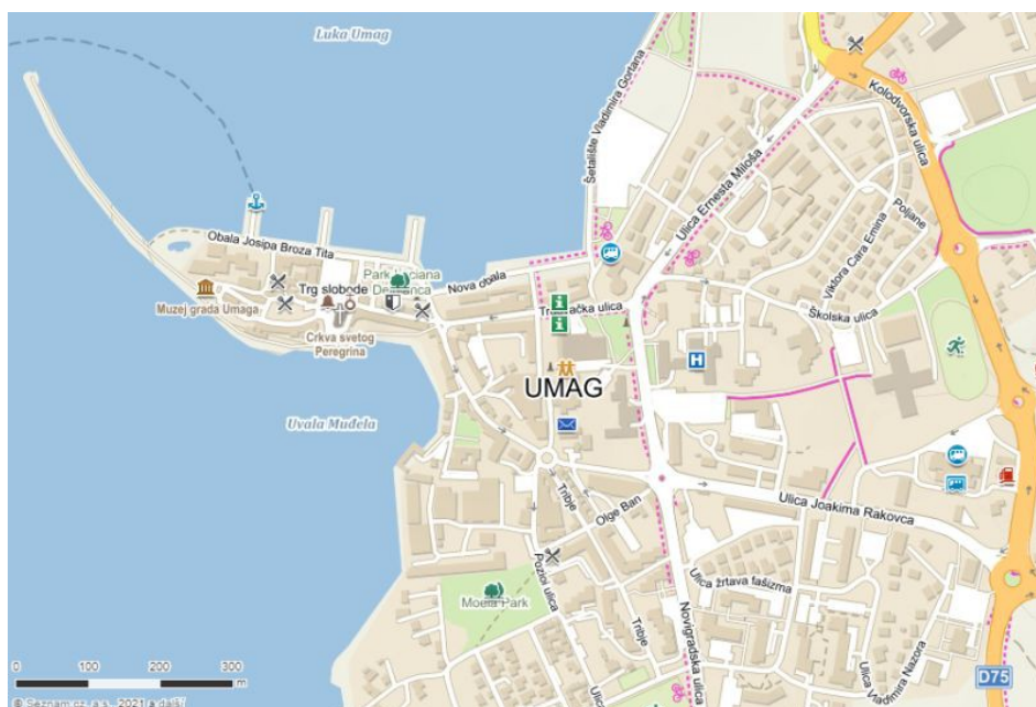
Mapa centra Umagu

Umag (italsky Umago), je chorvatské přístavní město ležící na západě země, na pobřeží Jaderského moře, na severozápadě Istrijského poloostrova, v blízkosti chorvatsko-slovinské hranice. Umag leží asi 73 km západně od Rijeki, 68 km severozápadně od Puly, 11 km jihozápadně od slovinského města Piran a 30 km jihozápadně od italského Terstu. Administrativně patří město Umag do Istrijské župy. V roce 2011 měl Umag 13 467 obyvatel a byl čtvrtým největším městem Istrijské župy co do počtu obyvatel. Město je známé nejen jako oblíbené letovisko na Istrii ale také jako místo pořádání tradičního antukového tenisového turnaje ATP Croatia Open.