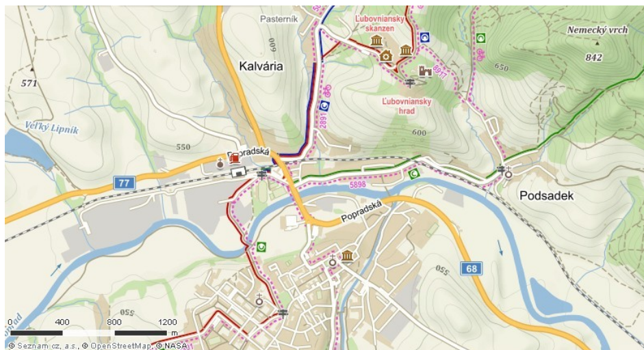
Mapa centra Staré Ľubovni

Stará Ľubovňa je okresní město patřící do Prešovského kraje a do regionu Spiš, do jeho části Horný Spiš. Stará Ľubovňa leží na východním Slovensku, na soutoku řek Poprad a Jakubianka v Ľubovnianskej kotline asi 63 km severozápadně od Prešova, 45 km severovýchodně od Popradu a 15 km jižně od hranic s Polskem.