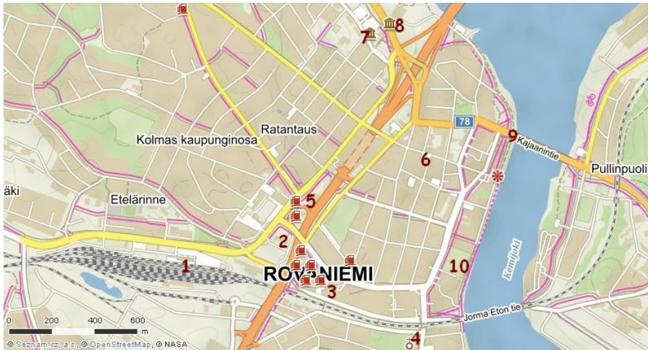
Mapa centra Rovaniemi

Rovaniemi je město ležící na severu Finska, v provincii Laponsko (Lappi, Lappland) jejímž je administrativním centrem. Vzdálenost od Helsinek je cca 800 km. Město leží při soutoku řek Kemi a Ounas, jen několik kilometrů jižně od severního polárního kruhu.