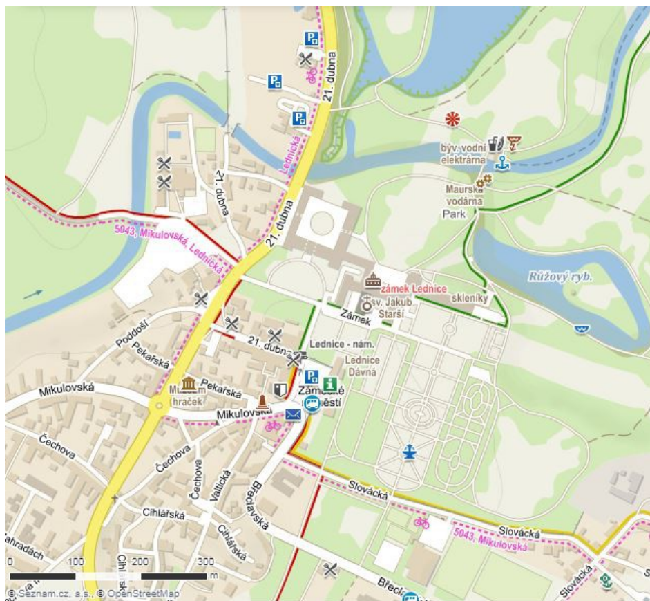
Mapa centra Lednice

Lednice leží na silnici II. Třídy č. 422 mezi Valticemi a Podivínem.