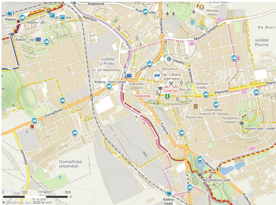
Mapa centra Klatov

Ve městě jsou tři autobusové linky MHD a zajišťuje je společnost ČSAD autobusy Plzeň a.s. . Jedna jízda stojí 8 Kč, jízdenky jsou nepřestupné. Více informací a schéma linek najdete na http://www.klatovynet.cz/www/data/klatovy/mhd/