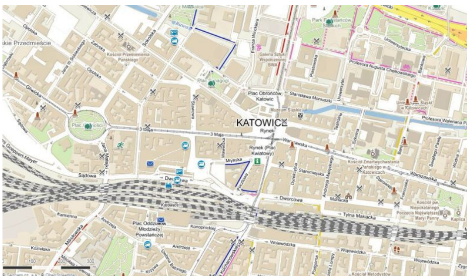
Mapa centra Katowic

Katowice (česky Katowice, německy Kattowitz, v letech 1953-56 Stalinogród) jsou město ležící v jižním Polsku, asi 85 km severovýchodně od Ostravy. Je to největší město hornoslezské průmyslové aglomerace (kam patří například i Sosnowiec, Chorzow, Bytom, Gliwice, Zabrze), jsou významným průmyslovým centrem, dopravní křižovatkou a také významným městem historického Horního Slezska. Nyní jsou Katowice administrativním centrem Slezského vojvodství.