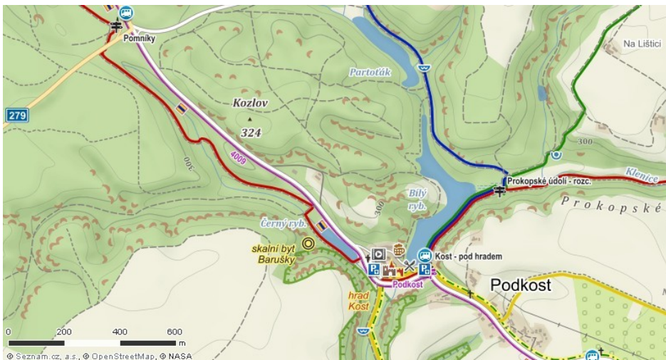
Turistická mapa okolí hradu Kost

Přehled hotelů v okolí hradu Kost s detailním popisem, recenzemi a možností online rezervace za nejlepší cenu najdete na Booking.com .