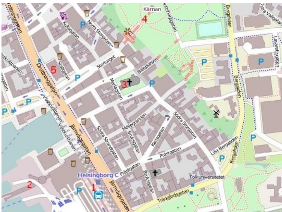
Mapa centra Helsingborgu

Přístaviště: Přístaviště odkud odplouvají trajekty do blízkého dánské Helsingør najdeme v sousedství vlakového nádraží Helsingborg centralstation.