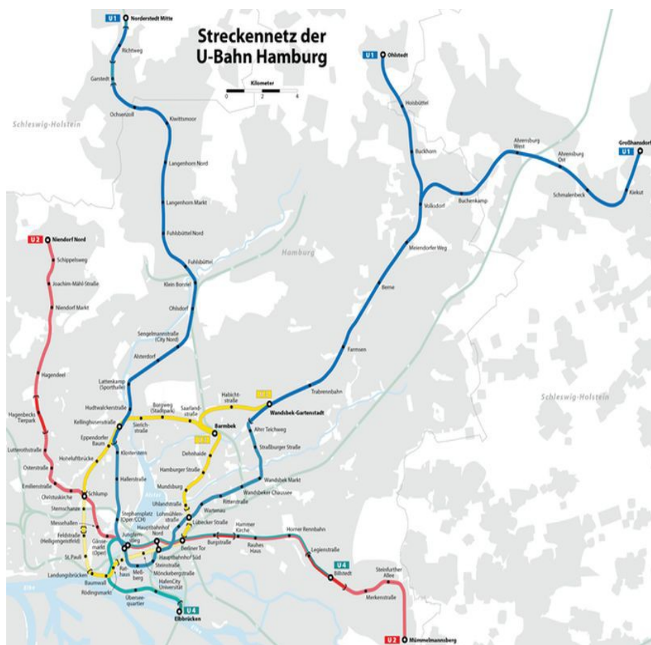
Plán hamburského metra. Autor: Maximilian Dörrbecker (Chumwa), Zdroj: commons.wikimedia.org Licence: CC-BY-SA 2.5

Hamburg a okolí je rozdělen na zóny. Centrum města a široké okolí včetně čtvrtí St. Pauli a Altona i včetně hamburského letiště jsou v zónách A, respektive Hamburg AB. Jízdenky lze koupit na kombinaci zón. Jízdenky pro zóny AB (Hamburg AB): Jednotlivá jízdenka stojí 3,30 EUR, na jednu cestu jedním směrem, lze přestupovat. Jednodenní jízdenka stojí 7,80 EUR, celodenní jízdenka s platností od 9 hodin stojí 6,50 EUR, pro skupinu až pěti osob pak 12,20 EUR. Jízdenky platí pro všechny druhy dopravy. Pro jízdu expresními autobusy (Schnellbus) musíte mít k jízdě příplatek za 2,10 EUR. Lze koupit i jízdenky na krátkou jízdu (Kurzstrecke) za 1,70 EUR. Jízdenky je nutno označit. Jízdenky lze koupit v automatech nebo v autobuse u řidiče (v hotovosti). Jízdní řády, trasy linek a další informace najdete na https://www.hvv.de