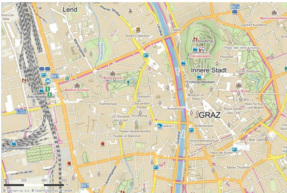
Mapa Grazu

Graz, česky Štýrský Hradec je hlavní město rakouské spolkové země Štýrsko. Graz leží na jihovýchodě Rakouska, na řece Mur (Mora), na úpatí horského hřebene Gleinalpe, který patří k pohorí Lavanttalské Alpy. Graz leží asi 45 km severně od rakousko-slovenské hranice, 65 km západně od rakousko-maďarské hranice a cca 145 km jihozápadně od Vídně. Graz, neboli Štýrský Hradec má více než 289000 obyvatel a je tímto druhým největším městem Rakouska co do počtu obyvatel. Historické centrum Grazu je zapsáno na Seznam světového dědictví UNESCO.