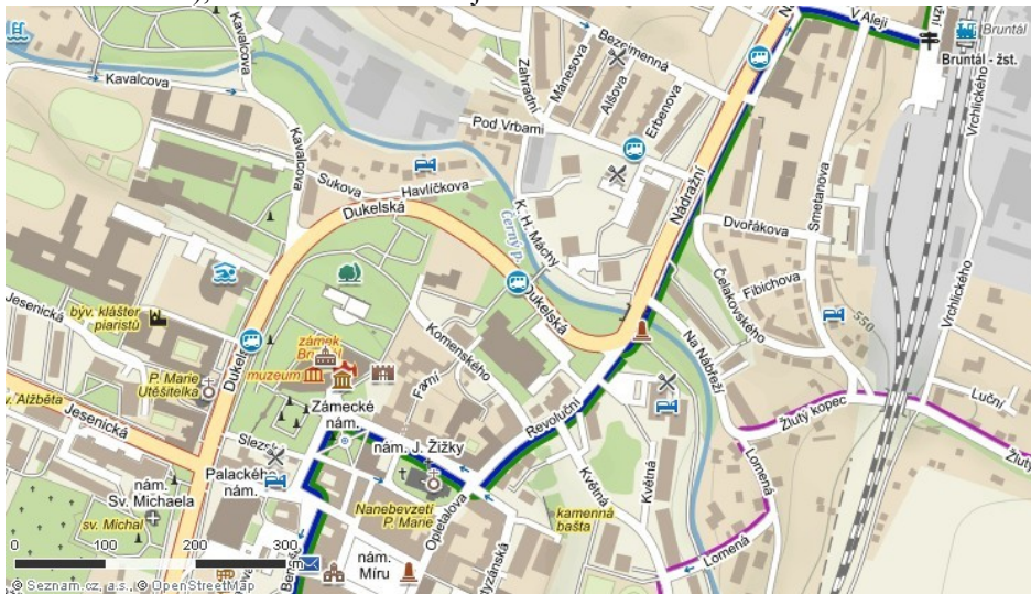
Turistická mapa okolí zámku Bruntál

Autem: Bruntál protíná silnice č.11 z Opavy na Šumperk a silnice č. 45 z Krnova směrem na Šternberk a dále na Olomouc. Nejbližší parkoviště je u kostela Nanebevzetí Panny Marie (GPS:49°59'22.161"N, 17°27'59.816"E) asi 150 metrů od zámku, a také blízko je parkoviště mezi ulicemi Dr. E. Beneše a Fügnerova (GPS:49°59'19.597"N, 17°27'50.739"E), vzdálenost od zámku je cca 200 metrů