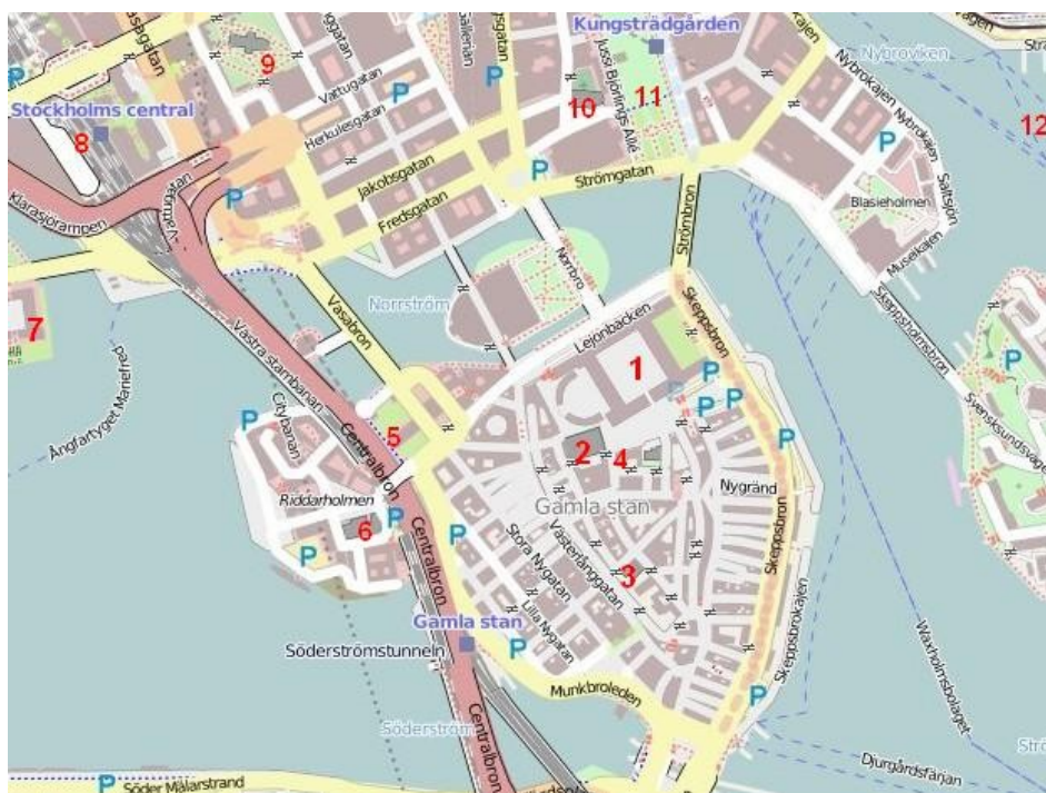
Mapa centra Stockholmu

Bus: Hlavní stockholmské autobusové nádraží Cityterminalen najdeme v centru města v blízkosti vlakového nádraží Stockholm Central. Nejbližší stanicí metra je T-Centralen. http://www.cityterminalen.com