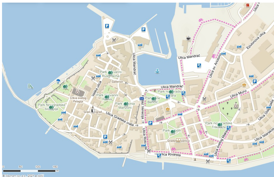
Mapa centra Novigradu

Novigrad (italsky Cittanova d'Istria), je chorvatské přístavní město ležící na západě země, na západě Istrijského poloostrova, při pobřeží Jaderského moře. Novigrad leží mezi městy Umag a Poreč, 14 km jižně od centra Umagu a 10 km severně od města Poreč, asi 70 km západně od Rijeky, 55 km severozápadně od Puly, 23 km jižně od slovinského města Piran a 39 km jihozápadně od italského Terstu. Administrativně patří město Novigrad do Istrijské župy. V roce 2011 měl samotný Novigrad 2622 obyvatel, celé město, ke kterému patří ještě sídla Antenal, Bužinija, Dajla a Mareda pak mělo 4345 obyvatel. Město je známé jako oblíbené letovisko na Istrii.