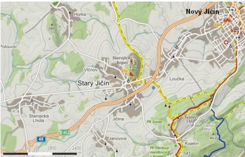
Turistická mapa okolí hradu Starý Jičín

Autem: Do Starého Jičína se dostaneme z Nového Jičína po silnici přes Loučku. Z dálnice D1 do Starého Jičína dojedeme po odbočení na silnici 48 respektive R48 u Bělotína, z této silnice pak u Starého Jičína sjedeme do obce. Nejbližší parkoviště je za kostelem u hřbitova (GPS: 49°34'43.898"N, 17°57'40.104"E) asi 800 metrů od hradu.