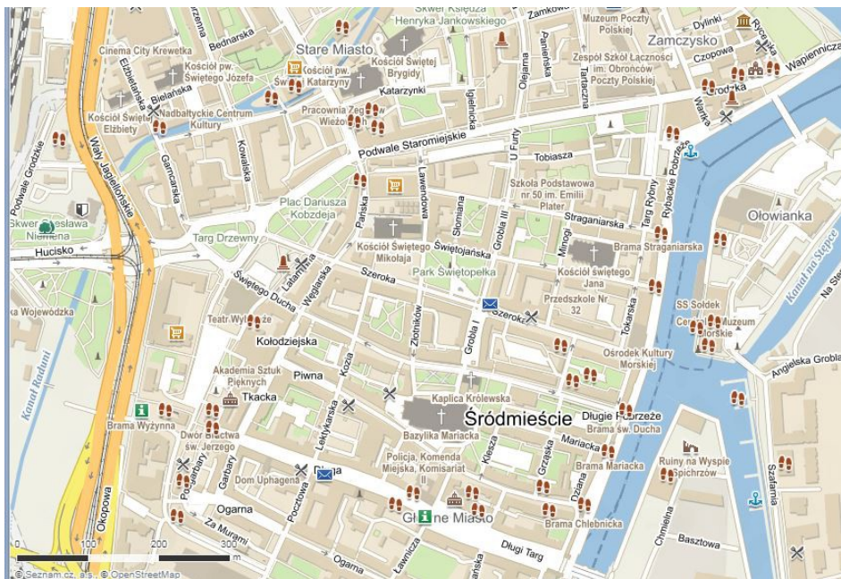
Mapa centra Gdaňska

Gdaňsk (polsky Gdańsk, dříve německy Danzig), je město na pobřeží Baltského moře u Gdaňského zálivu. Město leží na řece Visle a na jejím soutoku s řekou Motlavou. Gdaňsk je šesté nejlidnatější město Polska, žije zde více než 460 000 lidí. Gdaňsk je hlavním městem Pomorského vojvodství a spolu s městy Sopot a Gdynia tvoří aglomeraci zvanou Trojměstí (Trójmiasto).