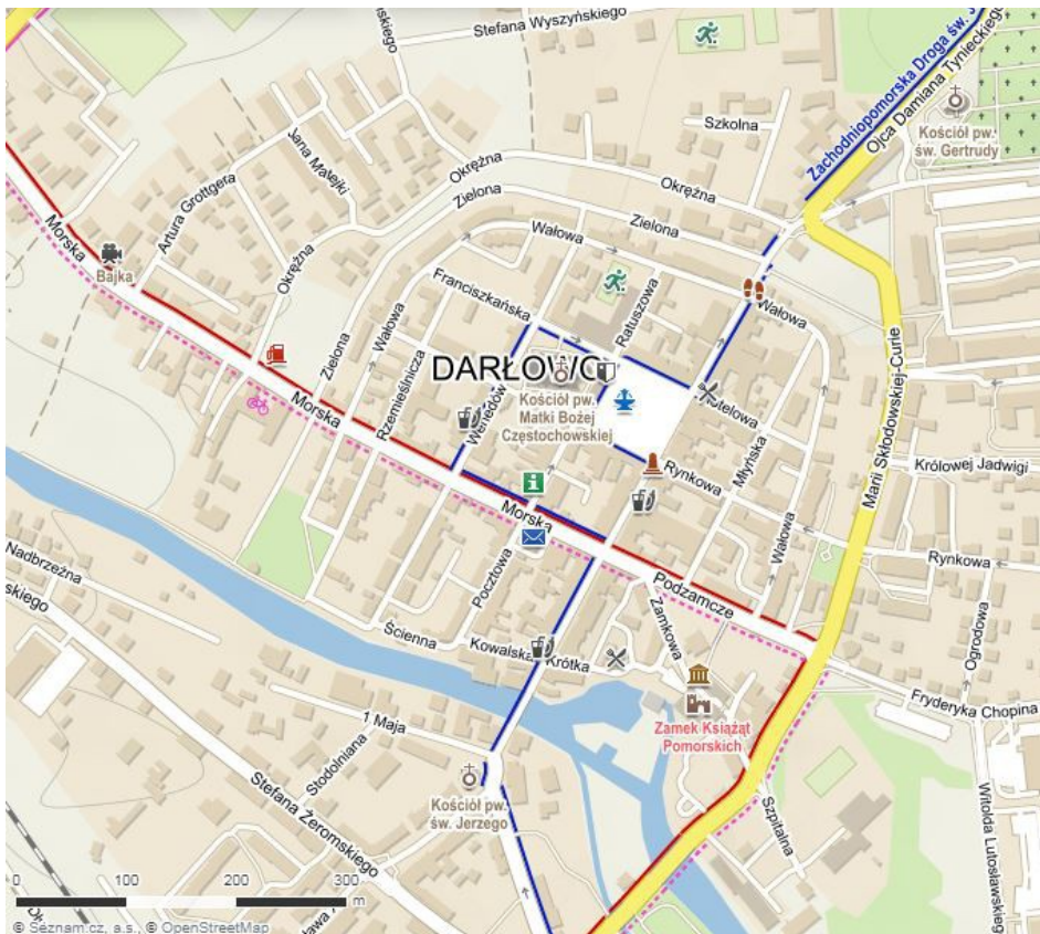
Mapa centra Darłowa

Darłowo (německy Rügenwalde) je historické město na severozápadě Polska v Západním Pomořansku, na pobřeží Baltu. Darłowo patří do Ślawieńskiego okresu v Západopomořanském vojvodství. K Darłowu patří také Darłowko, jenž je oblíbeným přímořským letoviskem s rozlehlou písčitou pláží.